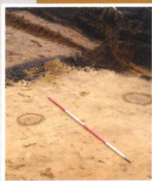
IJzertijdbewoning aan de Borneolaan