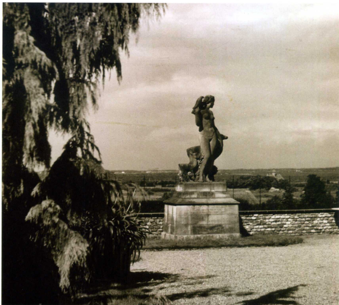
Het beeld aan de rand van het tennispark (achter de muur is nog net het vangnet te zien), eind jaren veertig, geeft met het uitzicht richting Bussum een buitenlandse sfeer.