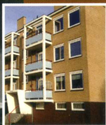
60 jaar het Kamrad