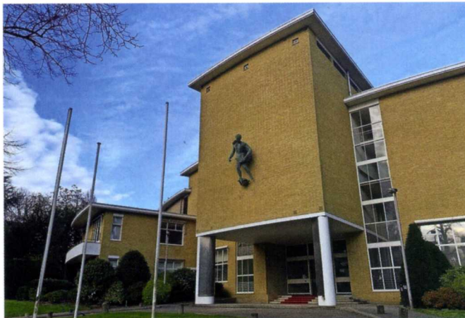
De voorgevel van de voormalige AVRO-studio aan de 's-Gravelandseweg met het beeld 'De Zaaier'.